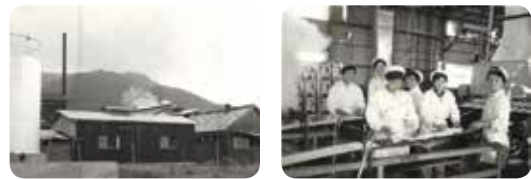
昭和30年代の工場のような